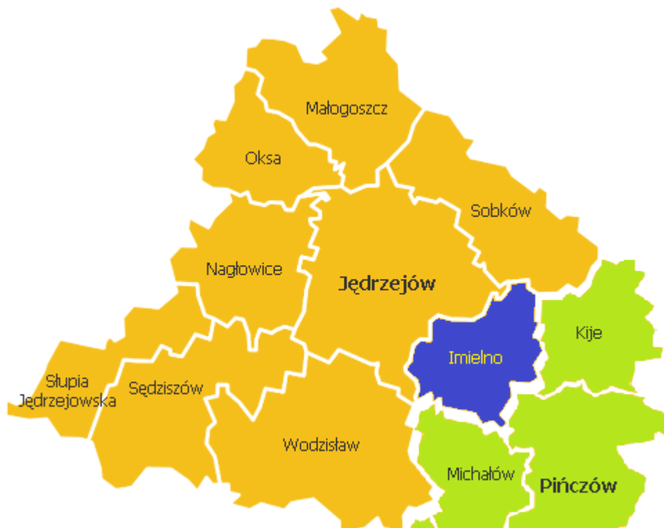
Rysunek 1. Powiat jędrzejowski i część powiatu pińczowskiego

Gmina graniczy z następującymi jednostkami: od strony zachodniej – gmina Wodzisław, gmina Jędrzejów, północnej – gmina Sobków, wszystkie położone w powiecie jędrzejowskim oraz gminy należące do powiatu pińczowskiego: gmina Kije i gmina Pińczów graniczące od strony wschodniej oraz gmina Michałów sąsiadująca z gminą Imielno od południa.